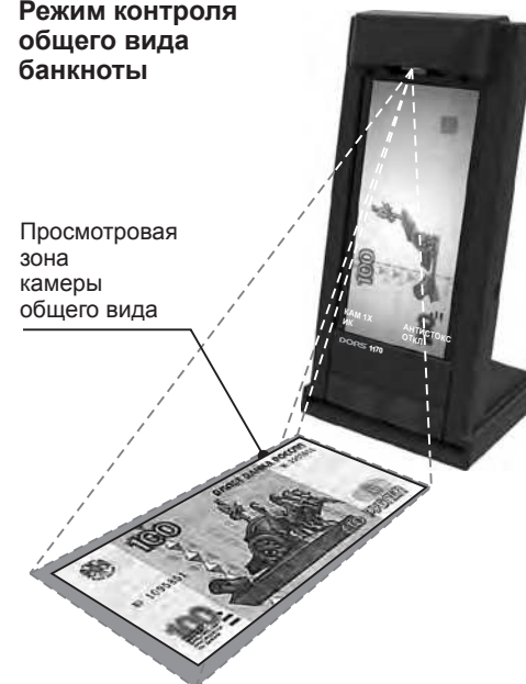
Рис. 2 Режим контроля общего вида банкноты